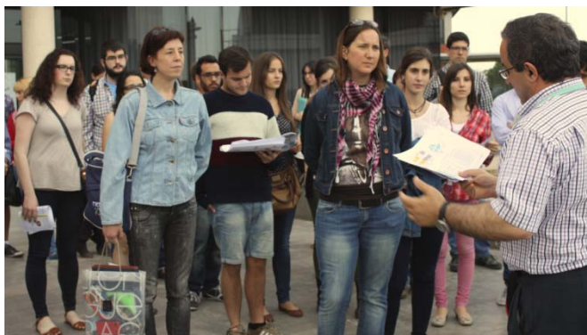
Organización grupos de voluntariado