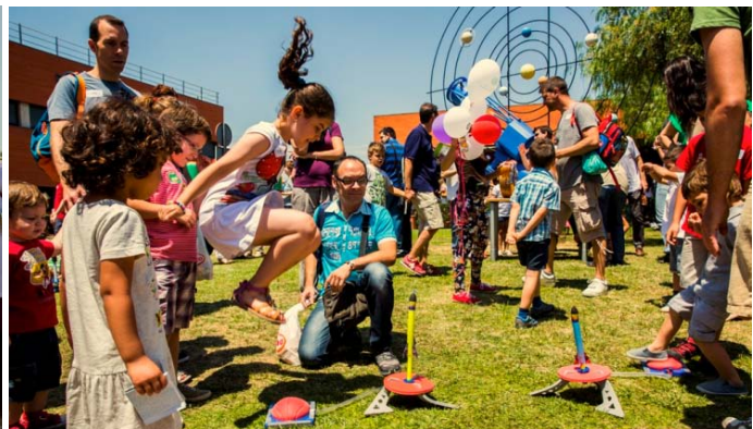
Jornada puertas abiertas Expociencia 2015