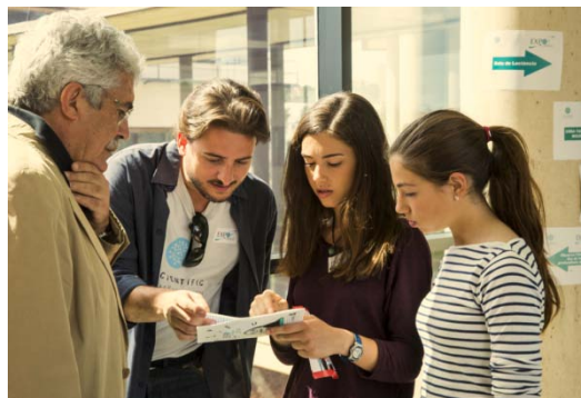
Formación y coordinación del voluntariado