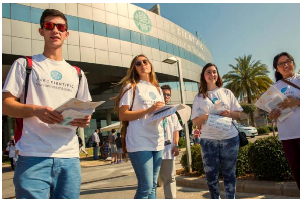
Alumnos voluntarios Expociencia 2015

A lo largo de estos 6 años EXPOCIENCIA se ha consolidado como uno de los eventos de Divulgación de la Ciencia y la Tecnología más masivos que se ha desarrollado, en una jornada, no sólo en la Universitat de València sino en toda la Comunidad Valenciana. Se cuenta con el apoyo altruista de un gran número de personal voluntario (tanto de los institutos de investigación y del personal de las empresas) que ofrecen sus recursos personales y su trabajo fuera de horario laboral para sacar adelante una iniciativa que pone de manifiesto la componente social de una institución como el Parc Científic de la Universitat de València.