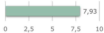
PUNTUALIZACIÓN GLOBAL DEL PCUV

Las empresas valoran de forma muy positiva el PCUV otorgándole una puntuación media de 7,93 (sobre 10).