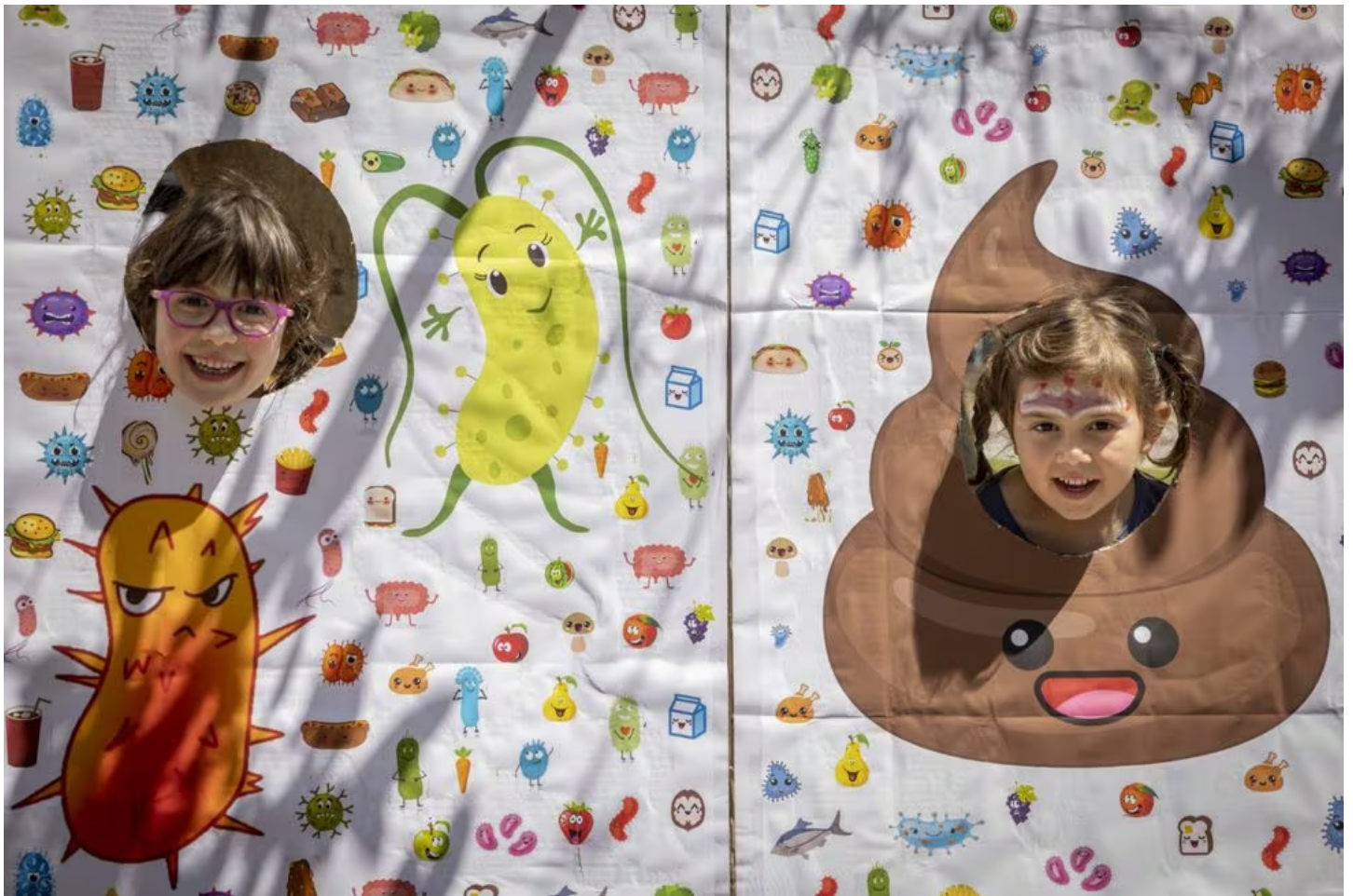
Dos niños en Expociència, el pasado año, en una imagen cedida. MIGUEL LORENZO

Despertar las vocaciones científicas y tecnológicas a una edad temprana es la misión desde hace tres lustros de Expociència, una cita única en la Comunitat Valenciana que forma deleitando en ciencia, tecnología e innovación, al calor de las instalaciones del Parc Científic de la Universitat de València (PCUV). Concebida para el público familiar, la capacidad de congregación apenas se ha alterado a lo largo de sus quince años de historia. Más de 4.000 visitantes acuden cada mayo para conocer, a través del juego y la diversión, los hitos, las curiosidades y los avances más destacados que nacen de los laboratorios y empresas de la institución académica.